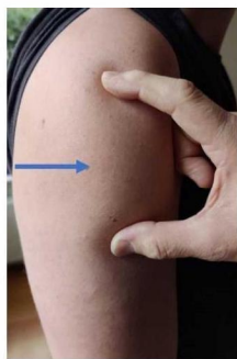
Figuur 1 plaats voor injectie.

Comirnaty wordt intramusculair (i.m.) toegediend in de bovenarm (m. deltoïdeus). Als er niet in de bovenarm gevaccineerd kan worden, kan de vaccinatie in het bovenbeen worden toegediend (m. vastus lateralis).